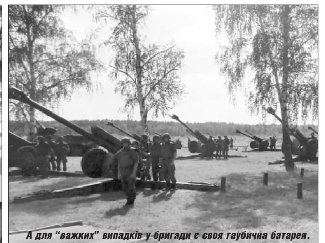
А для "важких" випадків у бригади є своя гаубична батарея.